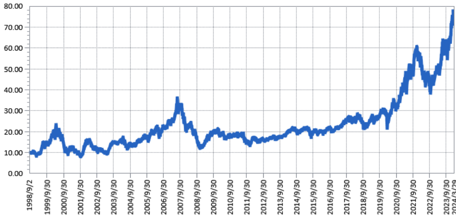
— 兆豐電子證券投資信託基金