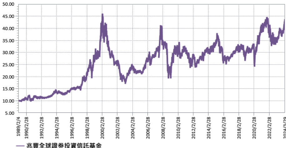
— 兆豐全球證券投資信託基金