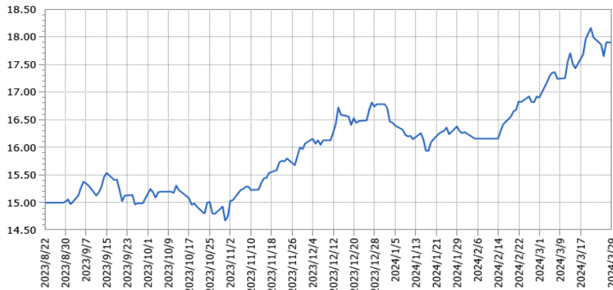
— 兆豐台灣ESG永續高股息等權重ETF證券投資信託基金