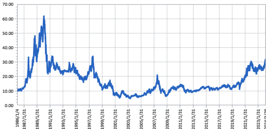
— 兆豐第一證券投資信託基金